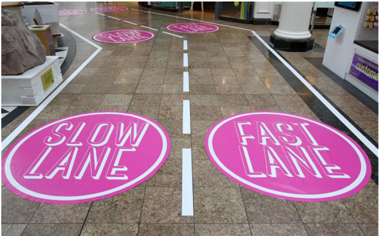
Omkörning till höger i England.

I England skrev en tioårig flicka ett brev till ett shoppingcenter och klagade på att hon bromsades upp av "människor som gick för långsamt". Något köpcentret genast hörsamade och prompt införde en snabbfil för de stressade.