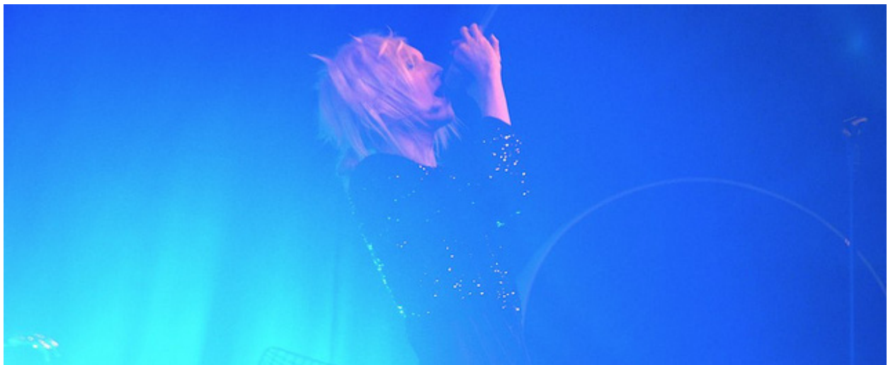
Yohio låter inte som rockstjärnor brukade göra.

Vi ser utvecklingen i statistiken, men vi ser de nya värderingarna även sippra igenom i media. När vår nye glamrockälskling Yohio uttalade sig i Aftonbladet efter Melodifestivalen sa han följande: "Jag har inget för att romantisera droger och alkohol som förstör kroppen. Om jag är en förebild för unga människor och tycker att det är okej, då tycker ju de att det är okej. Det är ju det som har hänt genom alla äckliga amerikanska artister som romantiserar att ha mycket tjejer, ha sex med allt och alla, dricka så du spy och ta droger."