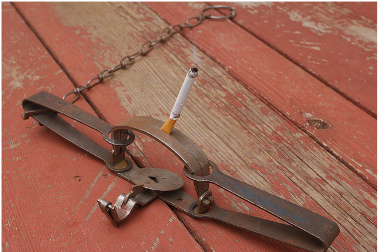
Allt färre fastnar i rökningens fälla.

Om man tittar på de lite äldre ungdomarna som går i gymnasiet så ser statistiken liknande ut. Andelen tjejer som inte dricker alkohol alls har ökat från 13 till 21 procent på tolv år, för killar har andelen gått från 12 till 22 procent. Andelen alkoholförgiftade ungdomar som kommit in till Maria ungdom har halverats sedan 2008. Ja även äldre dricker mindre – i alla fall på sjön – där antalet anmälda för sjöfylleri har halverats på bara två år. Och så vidare. Trenden tycks tydlig mot ökad skötsamhet.