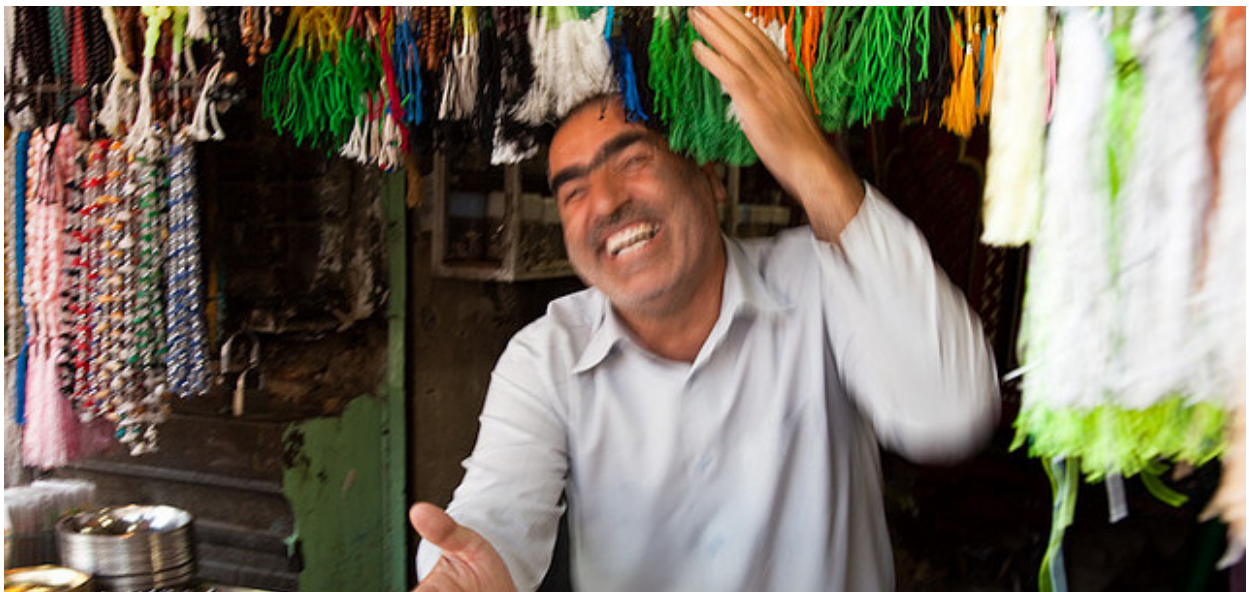
En framtidspersonlighet.

Det sägs att alla i Hollywood är trevliga mot varandra (förvisso ofta fejkat), för man vet aldrig vem som är viktigt – eller kommer att bli det längre fram. Nu är vi alla i showbusiness. Eller som Robin Sharma så elegant uttrycker det: "If you're in business, you're in showbusiness." Man anpassar sin personlighet och fogar lätt in sig för att inte verka taggig, svår eller bekymmersam.