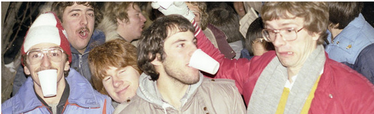
Fulla studenter - en allt ovanligare syn (Flickr: G A R N E T).

Om man ser till årets studentfester var berusningsgraden i genomsnitt 0,63 promille, vilket vetenskapen klassar som låg salongsberusning. I Stockholm så har antalet våldsbrott i samband med studentfester minskat från 250 stycken 2006 till under 30 stycken 2013.